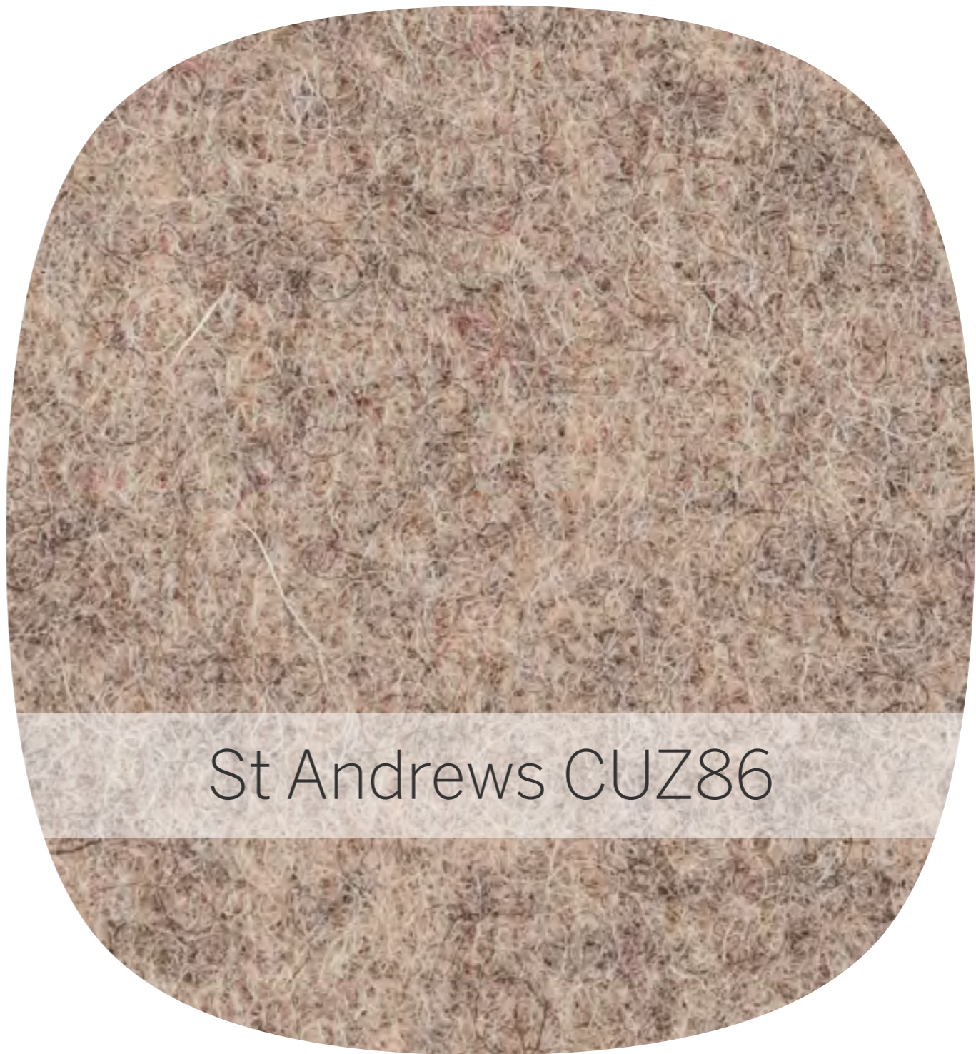
St Andrews CUZ86